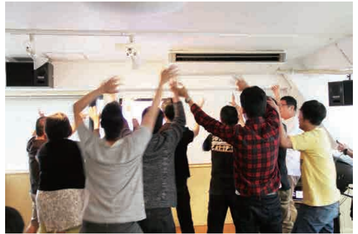
最後は先輩チームの大合唱。盛り上がりはピークに！！