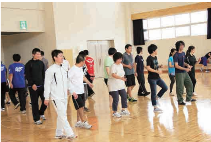
思った以上にハードでした(汗) 約1時間15分、心と体をリフレッシュ♪