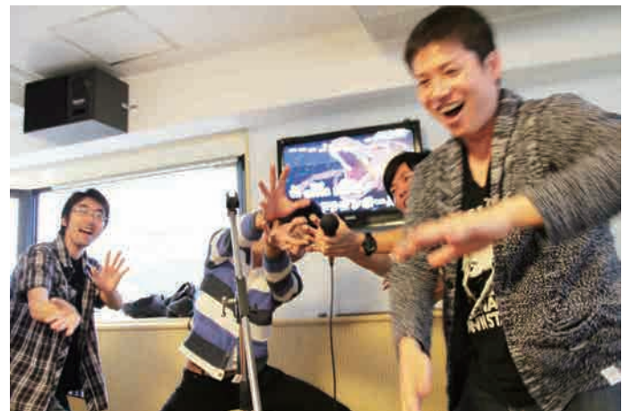
お腹を抱えて笑った後はお待ちかねの懇親会。ハピナハ近くカラオケレ・モ・ンの大部屋で大宴会。年代別カラオケ対決のトップバッターは若手チーム