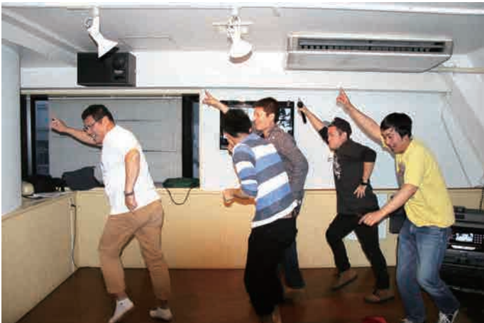
ステージでは、ノリノリの職員が入れ代わり立ち代わり大騒ぎ…。朝から大満足の一日となりました～月曜日からまた頑張るぞっ♪