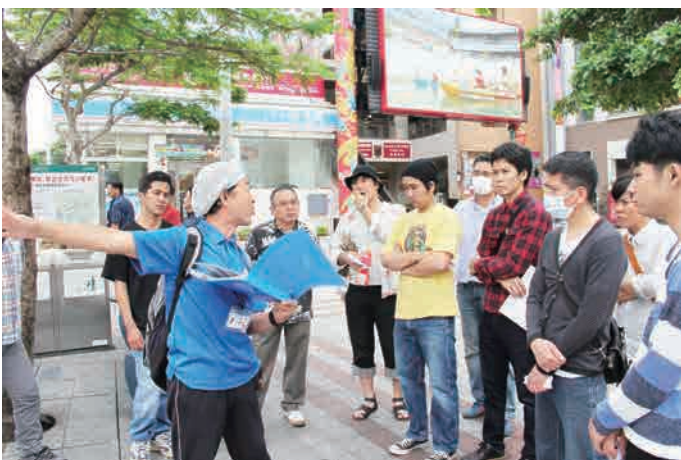
【コース】平和通り⇒むつみ橋通り⇒第一牧志公設市場⇒かりゆし通り⇒えびす通り⇒ちとせ商店街ビル⇒市場中央通り⇒パラソル通り⇒ひやみかちマチグワーマジック館