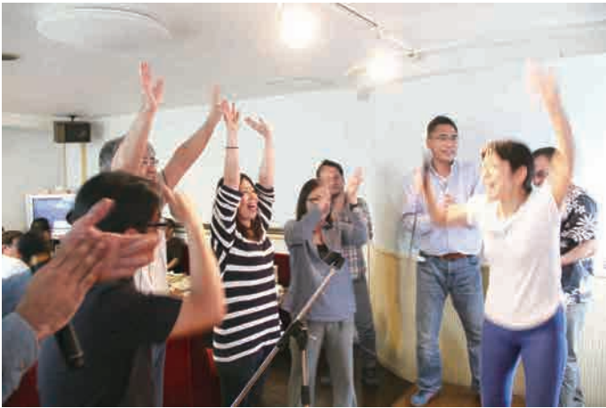
続いて中堅Aチーム、中堅Bチームが盛り上げます