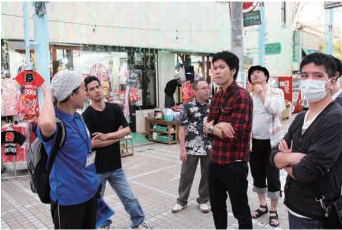
初めて知る商店街形成の歴史やおもしろトリビアなど、とても有意義な時間となりました