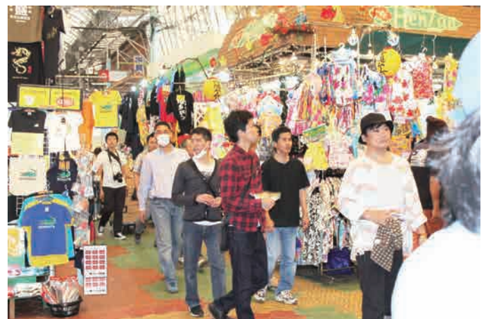
第一牧志公設市場を中心に縦横無尽に広がるアーケード街。迷路のようなアーケード街を散策