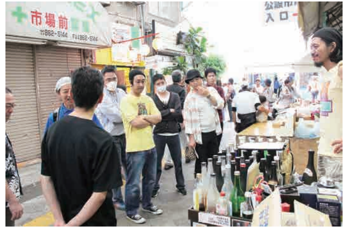
泡盛を数多く取り扱う店舗前から何故か離れようとしていないメンバー