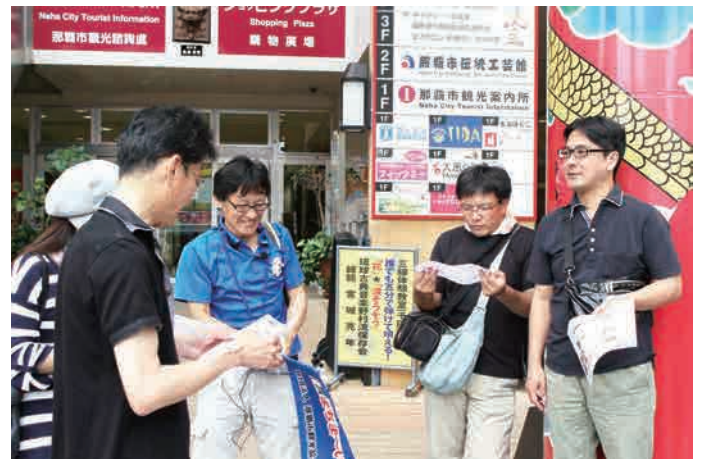
各自で昼食を済ませ、午後にてんぶす那覇広場前に集合。30名の団体が3チームに分かれて那覇のマチグワーマジックめぐりスタートです