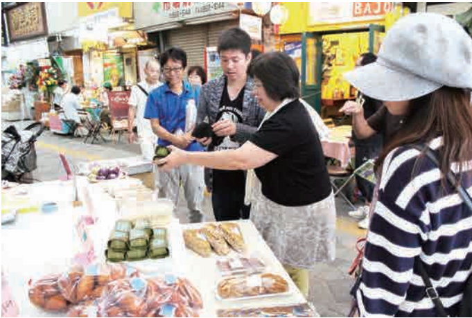
つつい買い物しちゃいます♪