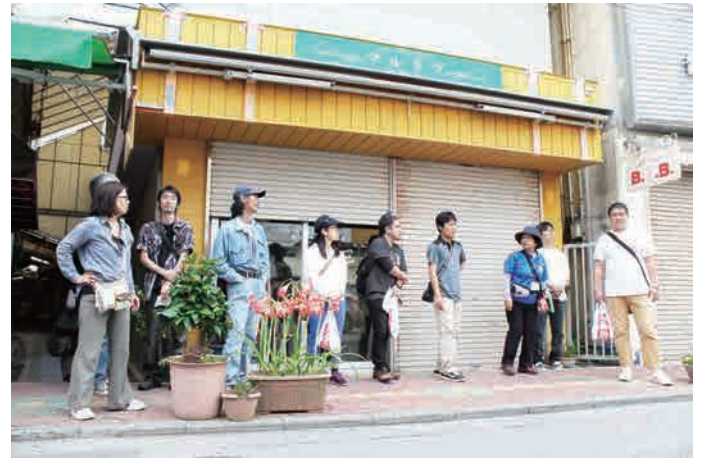
那覇市観光協会のガイドの方の丁寧なコース案内に大満足した1時間15分でした～